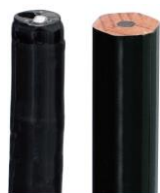
経鼻内視鏡 ▲ ▲ えんぴつ